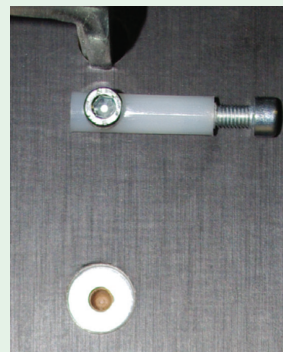
afb. 3 - Zoolbegrenzer opzij

Dat is mogelijk door de begrenzers die op de mal zijn gemonteerd. Draai deze opzij (afb. 3) en de ring volgt het contour van de mal.