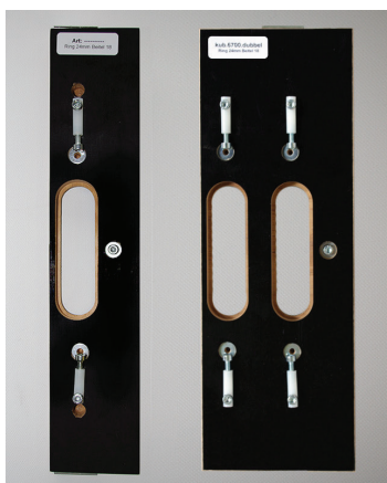
afb. 1 - Freesmal

Er zijn twee varianten te verkrijgen. Een enkele en een dubbele freesmal (afb. 1). Een enkele freesmal is alleen te gebruiken in een sponing van 43 mm of kleiner. Bij een sponing groter dan 43 mm wordt een dubbele freesmal gebruikt. Als het scharnier hoger is dan 95 mm of breder dan 29 mm, dan is deze alleen in een dubbele uitvoering te verkrijgen.