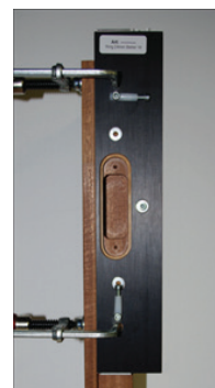
afb. 6 - Mal in kozijn