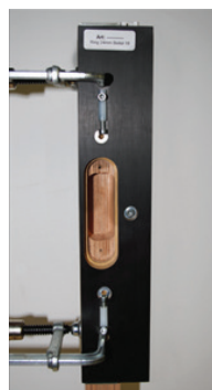
afb. 5 - Mal op deur

De begrenzers zijn instelbaar en daardoor aan te passen aan de zool van ieder type bovenfrees.