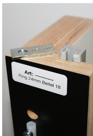
afb. 2 - Aanslag op de deur

De freesmal heeft de gebruikelijke aanslaglip op de kop van de buitenste plankjes. Dit zorgt voor een aanslag aan de bovenkant van deur en voor 2 mm speling tussen deur en kozijn (afb. 2).