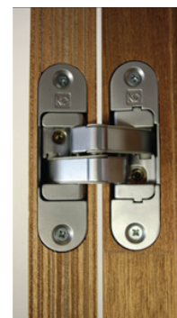
afb. 7 - Resultaat